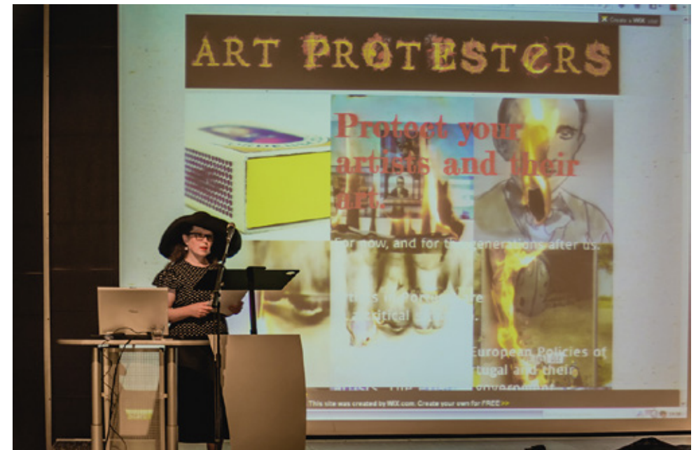
Installationsansichten: Videoinstallation / Lecture IN ART WE TRUST REACT - Künstlerpositionen des ökoRausch-Festivals 2013 / Rautenstrauch-Joest-Museum, Köln